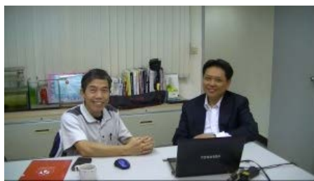
電通系辦理「職場實鏡解密」計畫