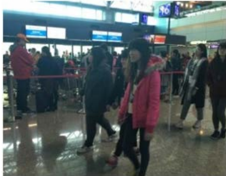
教學卓越計畫-「國際與商務旅運-會展及航空專業人才培育」