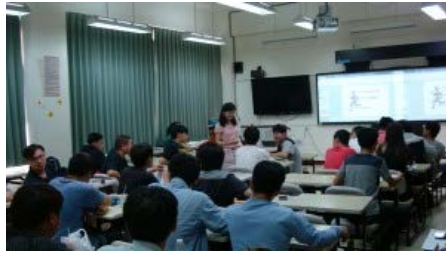
教學卓越計畫-「大一職涯探索知識經濟與產業講座」