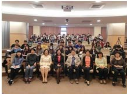
教學卓越計畫-「人文典範與當代學思1」