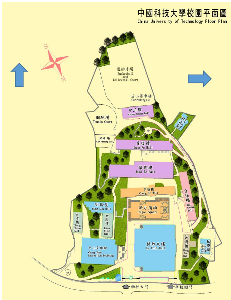
中國科技大學校園平面圖 China University of Technology Floor Plan