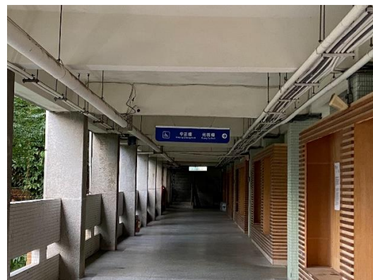
(出搭電直行右轉,為光復樓)