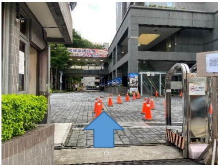
(請走行專用入口通道)