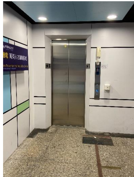
(請搭電梯至 5 樓)