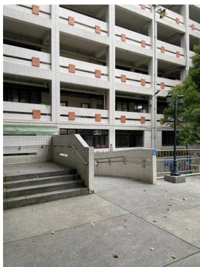
(直行一樓搭乘電梯至 R 樓右轉)