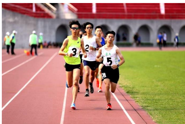
照片說明 3：大專男乙組 5,000 公尺競賽之 2