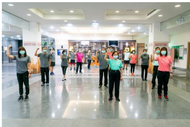
照片說明 5：中國科大主管及同仁宣示養成健康運動好習慣