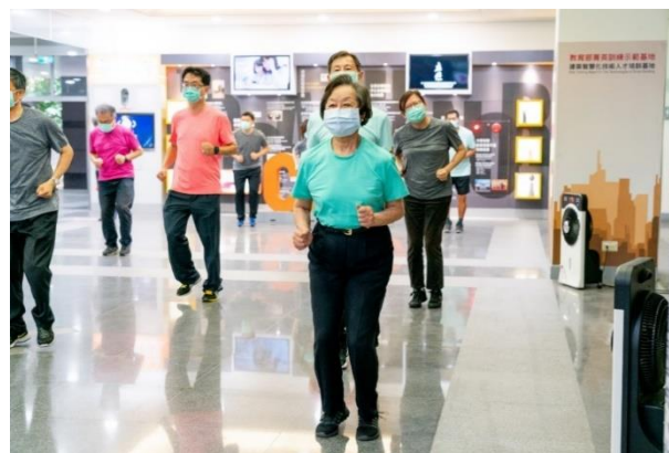
照片說明 4：中國科大上官董事長(中)全程參與健康操帶動跳活動