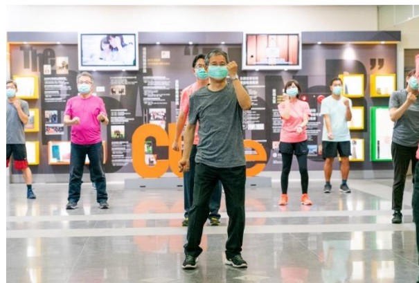
照片說明 6：中國科大唐彥博校長(中)參與活力健康操帶動跳活動