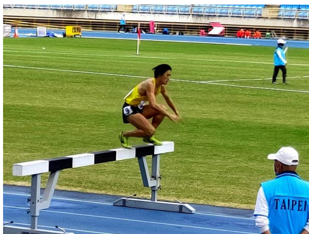
照片說明 1：公開男子組 3000 公尺障礙競賽