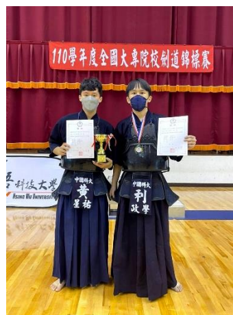
照片說明 2：本校榮獲公開男子團體過關賽第二名