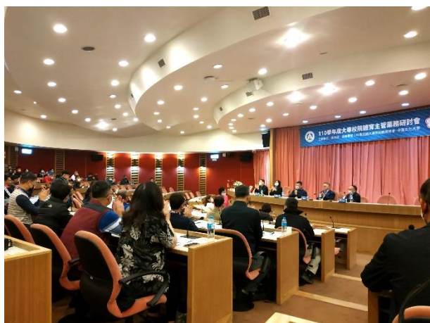
照片說明 3：大專校院體育主管業務研討會之 3