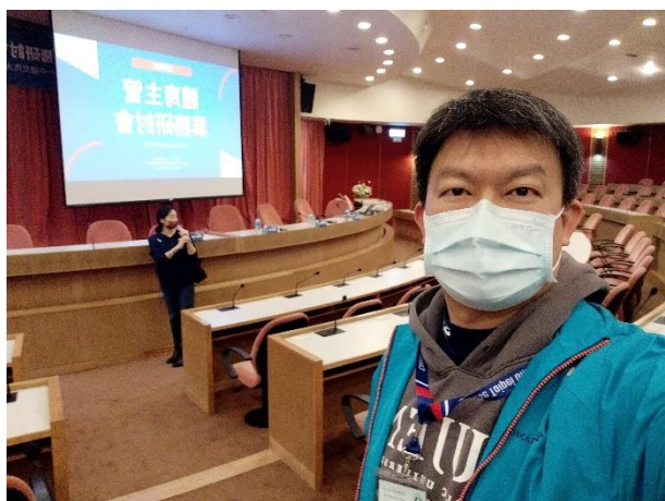
照片說明 1：大專校院體育主管業務研討會之 1