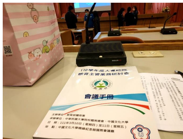
照片說明 2：大專校院體育主管業務研討會之 2