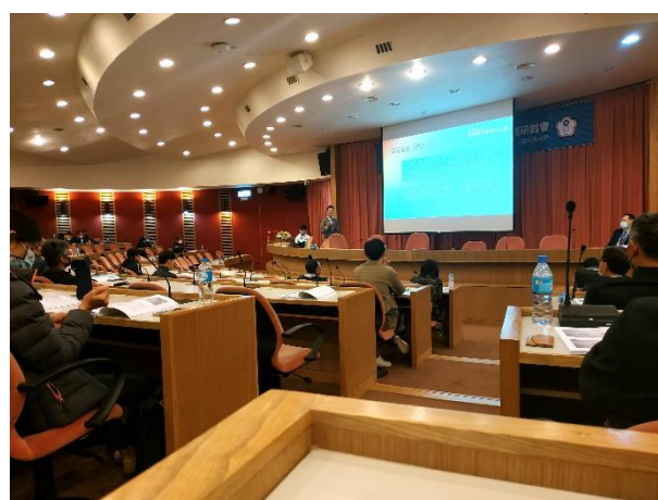
照片說明 6：大專校院體育主管業務研討會之 6