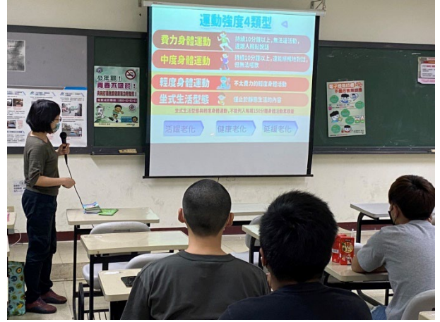
照片說明 2：運動與保健相關理論