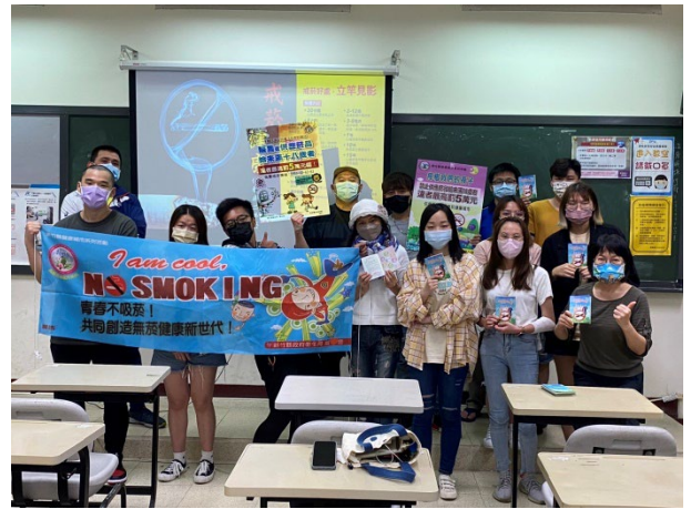
照片說明 4：全體師生合影