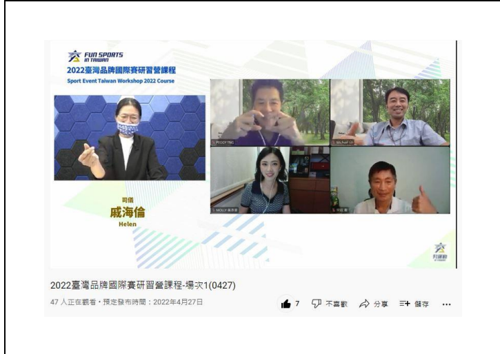
照片說明 4：臺灣品牌國際賽線上研習之 4