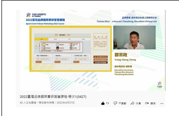
照片說明 2：臺灣品牌國際賽線上研習之 2