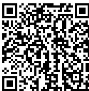
108(上)證照、競賽輔導報名系統QR code